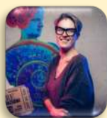
Dr.ssa Vera Gheno

Laureata in Sociologia, ha svolto esperienze di volontariato in Italia in diverse strutture sociali e sociosanitarie, presso associazioni che si occupano di sport e disabilità, nei servizi di urgenza ed emergenza, e in Africa in centri per bambini. Ha lavorato per molti anni nel campo dell'assistenza, della cura, dell'educazione e dell'accoglienza di persone adulte con disabilità intellettiva. Ha diretto una Comunità Alloggio a Como, è stata assessore alle Politiche Sociali e Vicesindaco, parlamentare e assessore alle Politiche sociali e della Famiglia di Regione Lombardia. Dal 22 ottobre 2022 è Ministro per le Disabilità nel governo Meloni.