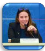
Alessandra Locatelli Ministro per le disabilità

Laureata in Sociologia, ha svolto esperienze di volontariato in Italia in diverse strutture sociali e sociosanitarie, presso associazioni che si occupano di sport e disabilità, nei servizi di urgenza ed emergenza, e in Africa in centri per bambini. Ha lavorato per molti anni nel campo dell'assistenza, della cura, dell'educazione e dell'accoglienza di persone adulte con disabilità intellettiva. Ha diretto una Comunità Alloggio a Como, è stata assessore alle Politiche Sociali e Vicesindaco, parlamentare e assessore alle Politiche sociali e della Famiglia di Regione Lombardia. Dal 22 ottobre 2022 è Ministro per le Disabilità nel governo Meloni.